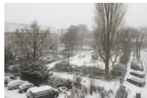
Winters zicht op Van Tuyl van Serooskerkenplein