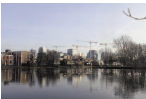
Zicht op Zuidas