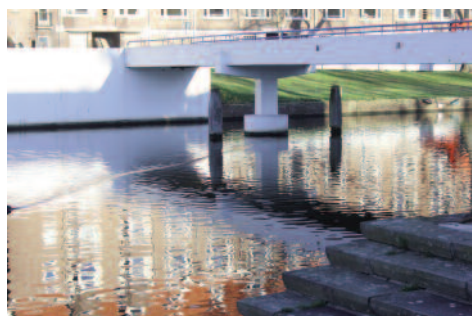
Brug over Stadionkade